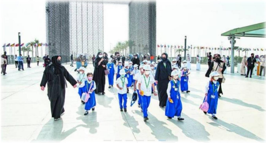
الملحق رقم (8): صورة مرفقة مع المقال " اكسبو 2020 مستقبل التعليم في الإمارات "

العدد "12": نلاحظ في المقال الأول لهذا العدد المعنون ب " زاباليتا: إكسبو دبي مبهر للغاية " انه تم ابراز معرض اكسبو 2020 كوجهة استثنائية لنجوم الرياضة العالميين من خلال سرد تجربة لاعب عالمي شهير من مانشستر سيتي حيث عبر عن انبهاره بالحدث وإبراز صورته فيه وهو في اتم السعادة والانبهار كما هو موضح اسفله، مما يبرز معرض اكسبو خاصة ودبي عامة كمنصة جذابة، كما نلاحظ أيضا بشكل غير مباشر الربط بين نجاح النادي الإنجليزي واستثمارات إماراتية ما يعزز من صورة الامارات كمساهم في النجاحات الدولية والرياضة والابتكار.