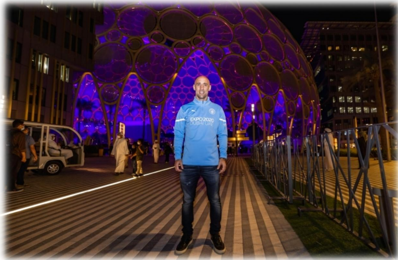
الملحق رقم (9): صورة مرفقة مع المقال " زاباليتا: إكسبو دبي مبهر للغاية "

العدد "12": نلاحظ في المقال الأول لهذا العدد المعنون ب " زاباليتا: إكسبو دبي مبهر للغاية " انه تم ابراز معرض اكسبو 2020 كوجهة استثنائية لنجوم الرياضة العالميين من خلال سرد تجربة لاعب عالمي شهير من مانشستر سيتي حيث عبر عن انبهاره بالحدث وإبراز صورته فيه وهو في اتم السعادة والانبهار كما هو موضح اسفله، مما يبرز معرض اكسبو خاصة ودبي عامة كمنصة جذابة، كما نلاحظ أيضا بشكل غير مباشر الربط بين نجاح النادي الإنجليزي واستثمارات إماراتية ما يعزز من صورة الامارات كمساهم في النجاحات الدولية والرياضة والابتكار.